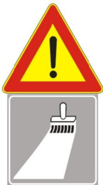
Figura II 391 Art. 31