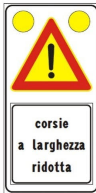
Figura II 391c Art. 31